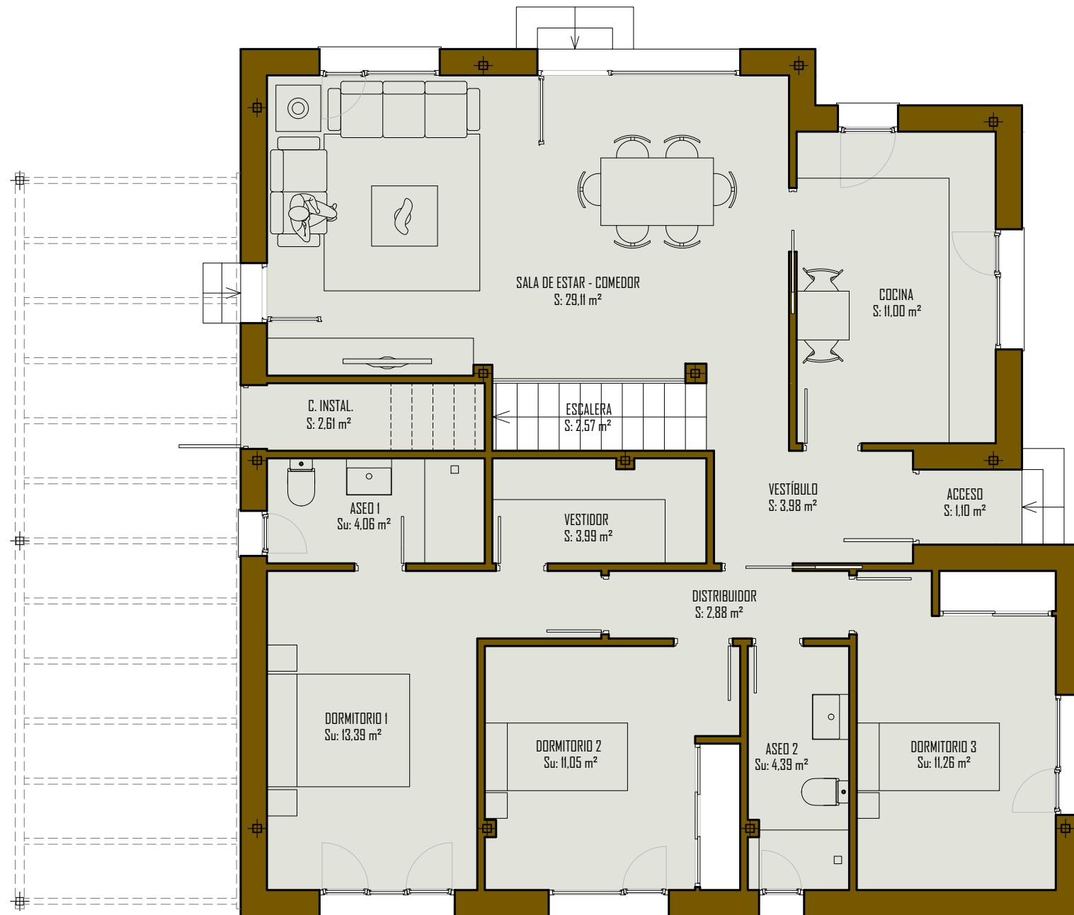
CUADRO DE SUPERFICIES